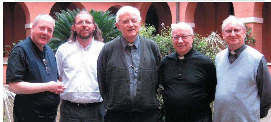
Il Padre Generale e la nuova Curia: